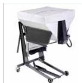
□ Salt- og grusspreder