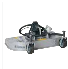
■ Rotor-/multiklipper m./u. opsamling 1000