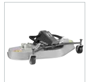
■ Rotor-/multiklipper 1500