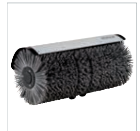
□ Svingbar kost