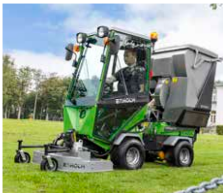
Rotor-/multiklipper 1000 med græsopsamler