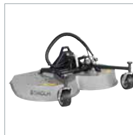
■ Rotor-/multiklipper 1200