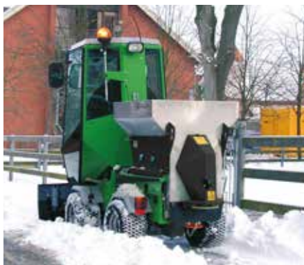
Salt- og grusspreder