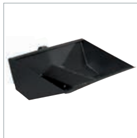
■ Vipbar skovl