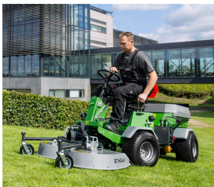
Tondeuse rotative/mulching 1200