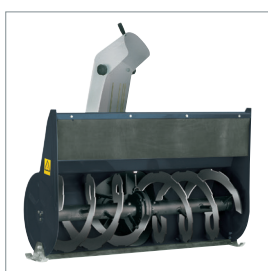
Fraise à neige