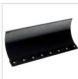
Lame à neige