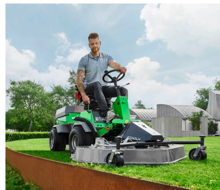
Tondeuse rotative/mulching 1500