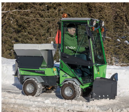
Lame chasse-neige en V