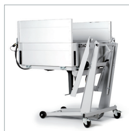
Porte-charge avec fonction de bascule