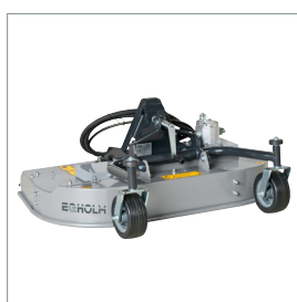
Tondeuse rotative, mulching ou collecteur d'herbe 1000