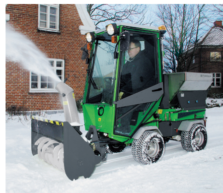
Fraise à neige