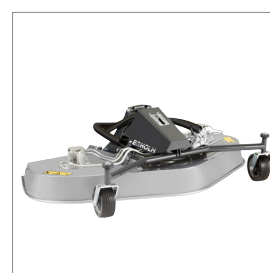
Tondeuse rotative ou mulching 1500