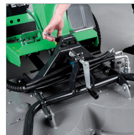
Changement rapide d'accessoire sans outil.

Pour plus d'informations concernant le Park Ranger 2150 et ses possibilités d'utilisation, rendez-vous sur www.egholm.fr .