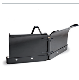
Lame chasse-neige en V