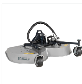
Tondeuse rotative ou mulching 1200