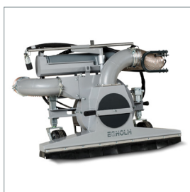
Aspirateur de feuilles