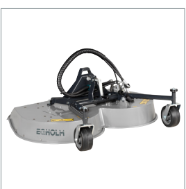
■ Rotor-/multiklippare 1200