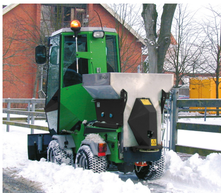
Salt- och sandspridare