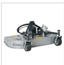
■ Rotor-/multiklippare m./u. uppsamlare 1000