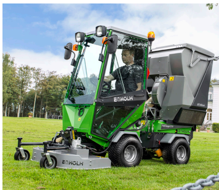
Rotor-/multiklippare 1000 med gräsuppsamlare