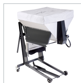
□ Salt- og grusspreder