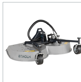
■ Rotor-/multiklipper 1200