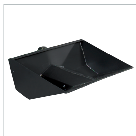
■ Vipbar skovl