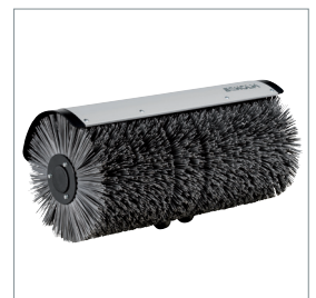
□ Svingbar kost