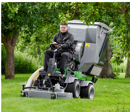
Rotor-/multiklipper 1000 med græsopsamler