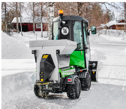
Salt- og grusspreder