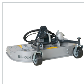
■ Rotor-/multiklipper m./u. opsamling 1000