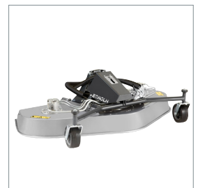
■ Rotor-/multiklipper 1500